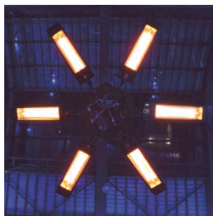
Lustre Blackburn 6 lampes