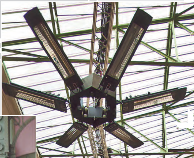
FIAC - Grand Palais