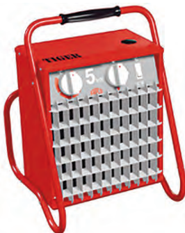
Aérotherme Tiger 15 Kw