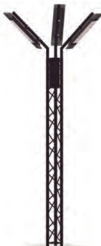
Totem Blackburn Hauteur 2,50 m