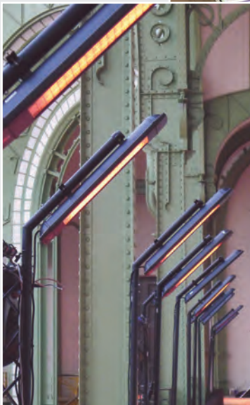
FIAC - Grand Palais

Aérothermes Radiateurs Infrarouges courts Infrarouges moyens Infrarouge long Rideaux