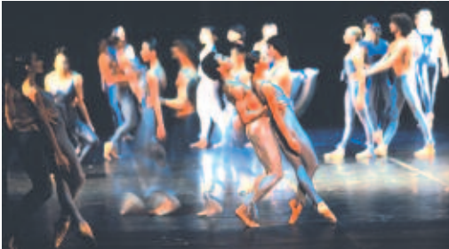
Light - Ballet du XXe siècle