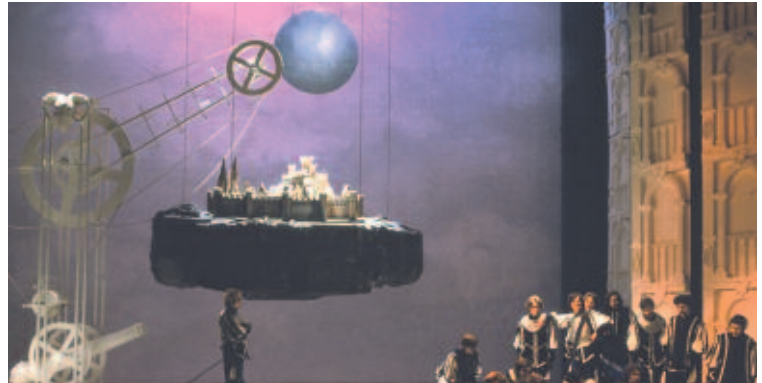
Cyrano de Bergerac - Théâtre National de Belgique - Photo D. Gaffé