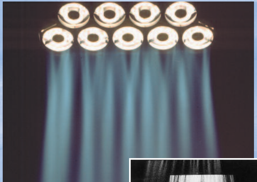
Le véritable "rideau de lumière"

Svoboda cherchait depuis longtemps un décor fait de lumière uniquement. Le résultat fut la SVOBODA, une herse de 2250 W ou 2500 W, composée de neuf ou dix lampes 24 V, produisant un faisceau extrêmement intense et presque parallèle, le "rideau de lumière". Utilisé en contre-jour, en douche ou comme éclairage frontal dur, la SVOBODA libère une lumière unique, douce et pourtant intense, qui crée une ambiance toute particulière.