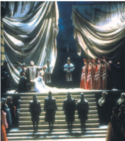
Bocca Negra - Opéra Royal de Wallonie