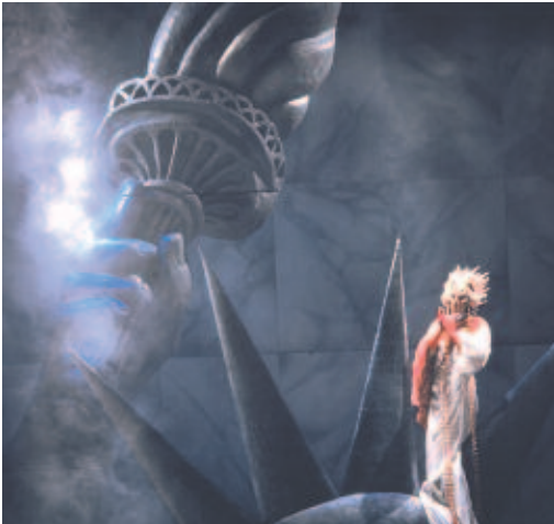
Caligula - Théâtre National de Belgique